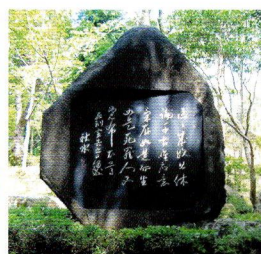
幸徳秋水絶筆の石碑